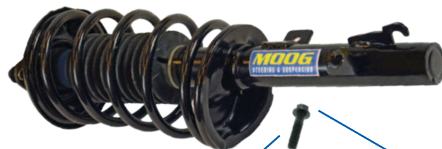
PERNO DE FIJACIÓN