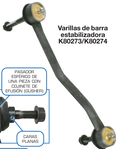
Varillas de barra estabilizadora K80273/K80274