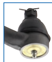
DS1235/1147 Barra transversal o Panhard