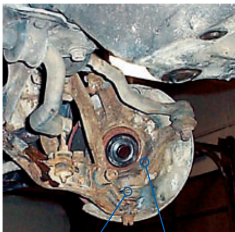
JUNTA DE RÓTULA

Las juntas de rótula inferiores de muchos modelos de Honda y Acura están colocadas a presión en el muñón de dirección y son difíciles de extraer y de instalar, especialmente cuando son viejas. Muchos técnicos golpean y martillan las juntas de rótula hacia afuera y hacia adentro. Esto lleva mucho tiempo, y puede dañar el muñón de dirección y la nueva junta de rótula.