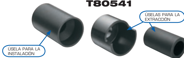
ÚSELA PARA LA INSTALACIÓN