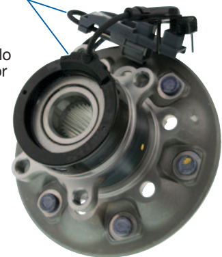
CONJUNTO DE CUBO MOOG (SE MUESTRA EL N° DE PARTE 515110)

Para las aplicaciones que lo requieran, los conjuntos de cubo de MOOG incluyen un anillo de sensor y un conector de arnés de cables.