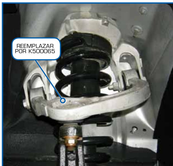
Conjunto de montaje del resorte y brazo de control superior

Cuando se necesita reemplazar la junta de rótula superior en estos vehículos, no se puede pedir al proveedor la junta de rótula superior de equipo original en forma separada. Sólo está disponible como parte del conjunto completo de montaje del resorte y brazo de control de aluminio.