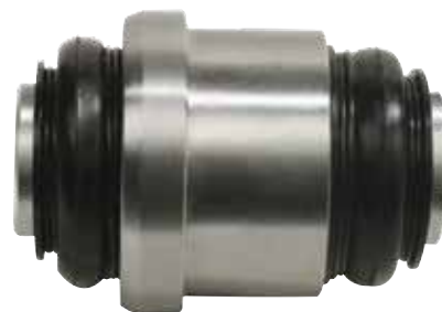
Buje superior del pivote MOOG K200174