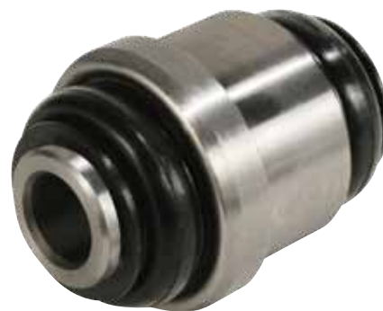
Buje inferior del pivote MOOG K200175