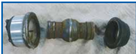
Buje del pivote de eje transversal desmontado